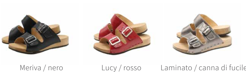
Meriva / nero