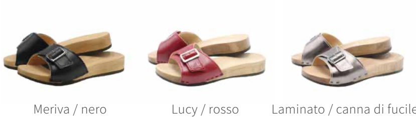
Meriva / nero